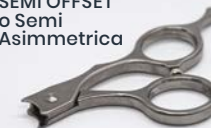
SEMI OFFSET o Semi Asimmetrica

Permette di mantenere, durante il processo di taglio, una posizione corretta del polso.